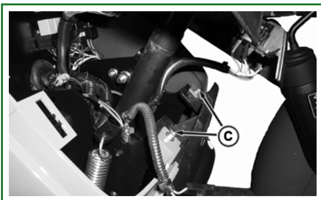
PULV003852-UN: Sechskantschrauben der Verkleidung